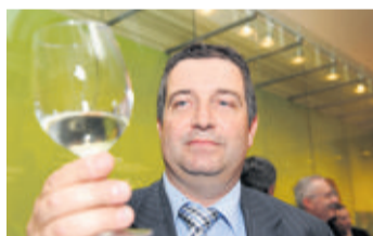
Le député UDC Pierre-Yves Rapaz apprécie le Chablais.